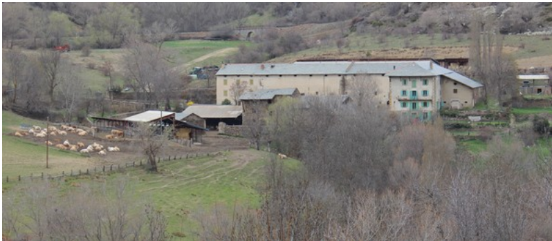
Le Mas Rondole