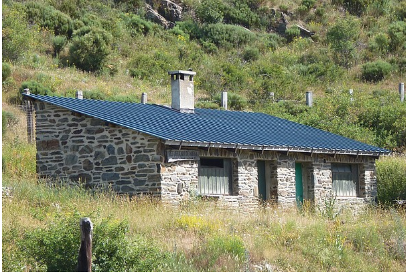
Refuge Camí de Núria (alt. 1750m)