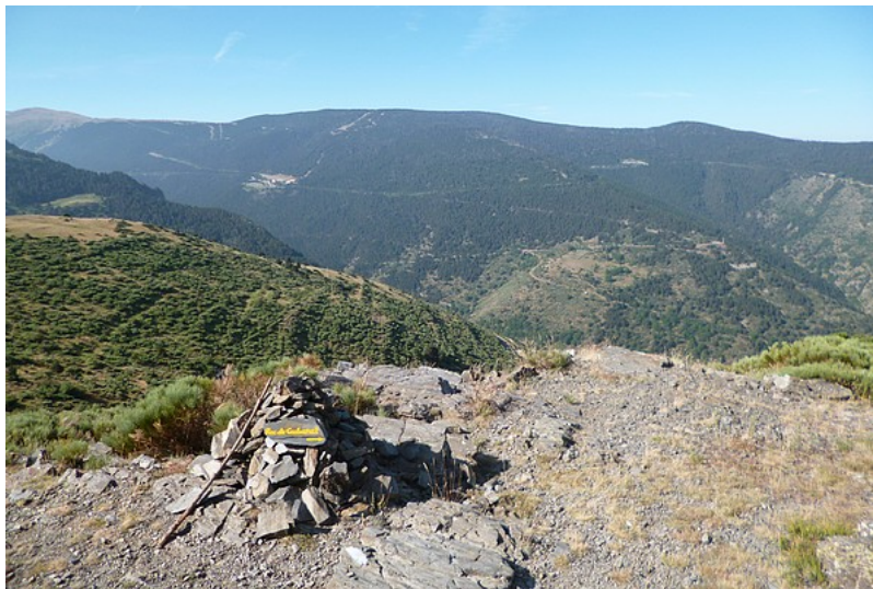
Vue sur la forêt communale d'Err depuis le col de la piste forestière