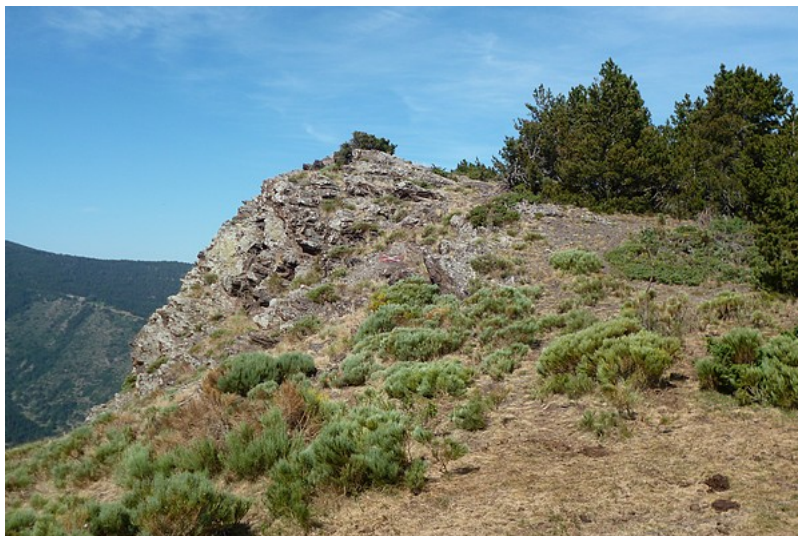
Roc de Carbanet (alt. 1847m)