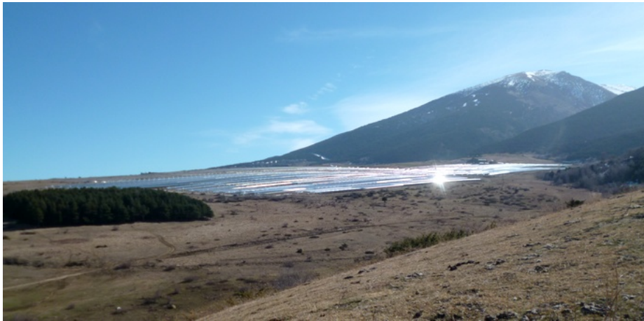
Centrale solaire eLLO