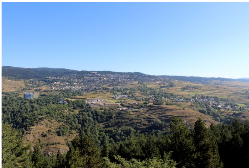
Vue de Font-Romeu depuis le sommet de La Baladosa