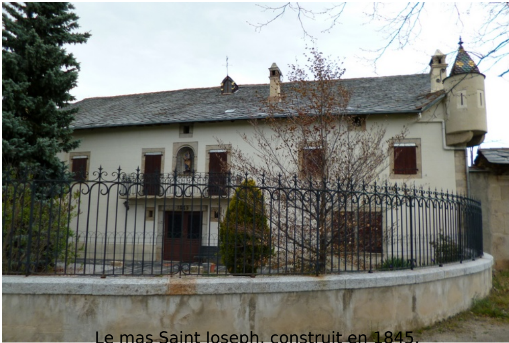
Le mas Saint Joseph, construit en 1845.