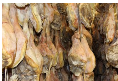
Séchoir à jambons