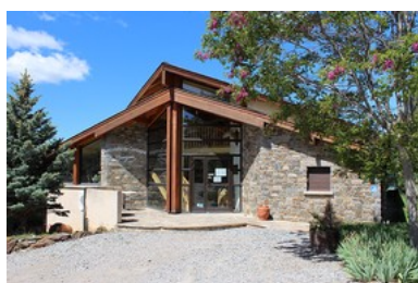
Entrée du musée