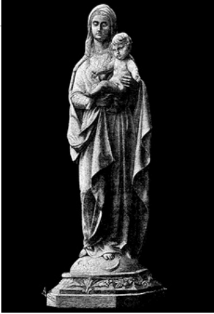
La vierge de Font-Romeu (Alexandre Oliva) inaugurée en juillet 1873