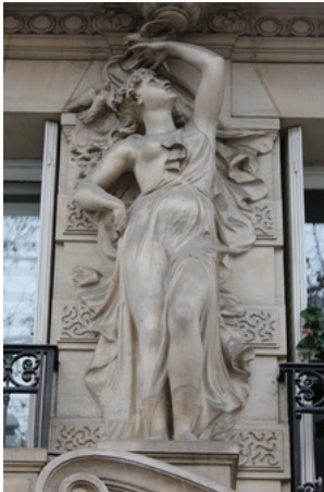
Statue du Printemps (Alexandre Oliva) - 88 Bd Saint-Michel (Paris - France)