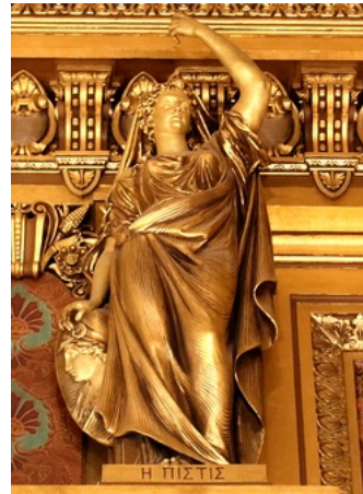
Statue La Foi (Alexandre Oliva) - Grand Foyer - Palais Garnier (Paris - France)