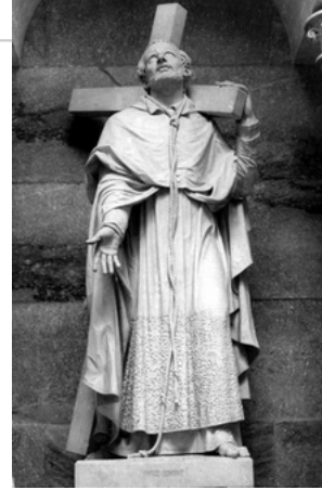
Saint Charles Borromée (Alexandre Oliva) - 1861 - Statue dans la chapelle de Carlos Alberto se trouvant dans les jardins du Palais Cristal (Porto - Portugal)