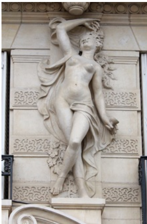
Statue de l'Automne (Alexandre Oliva) -