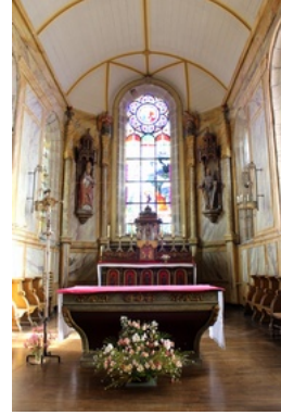
Chœur de l'église