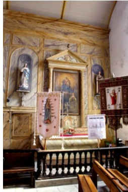
Autres photos de l'église