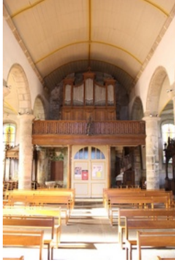
Orgue de l'église Saint-Pierre-et-Saint-Paul