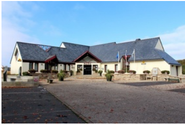
Mairie de Berven-Plouzévé