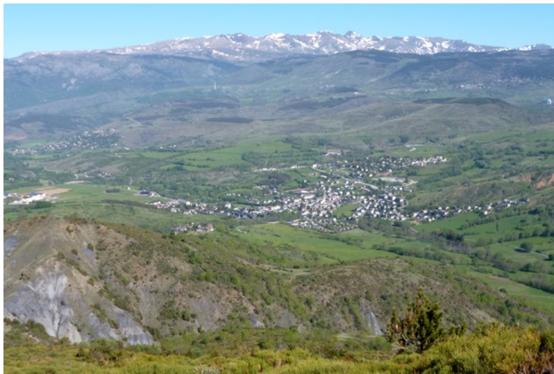
Vue de Saillagouse et de Vedrignans depuis le lieu Devesa del Pastoret