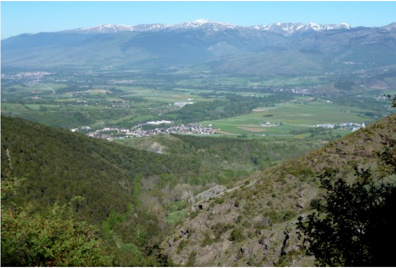
Vallée du Rec de les Deveses et vue partielle du plateau cerdan