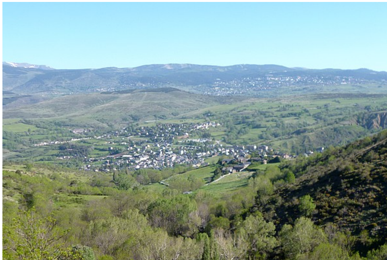
Vue de Saillagouse et de Vedrinyans dans la montée