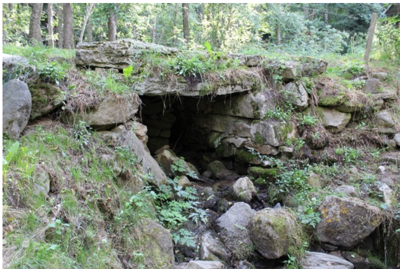
Pont mégalithique (alt. 1500m)