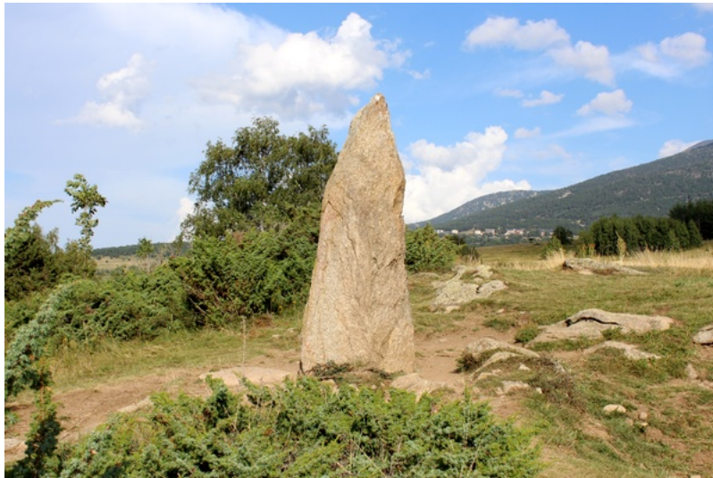
Menhir du Pla del Bosc - Autre appellation : menhir del Port