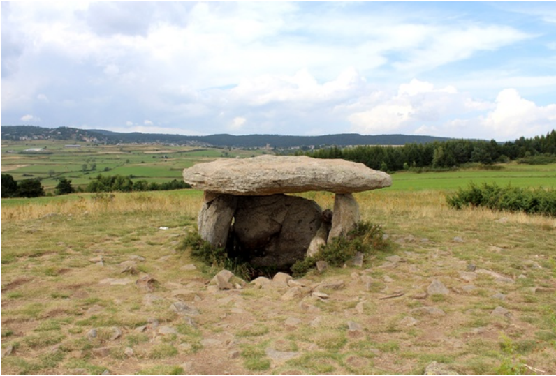
Dolmen Pascarets (alt. 1570m) - Autre appellation : dolmen de la Borda