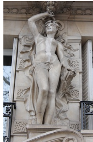
Statue de l'Été (Alexandre Oliva) - 88 Bd Saint-Michel (Paris - France)