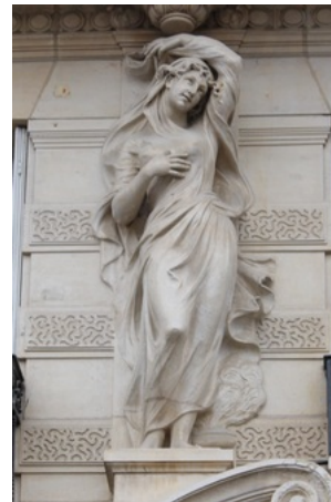
Statue de l'Hiver (Alexandre Oliva) - 25