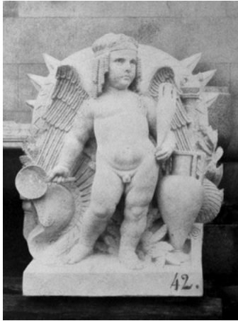
L'art étrusque - groupe (Alexandre Oliva)