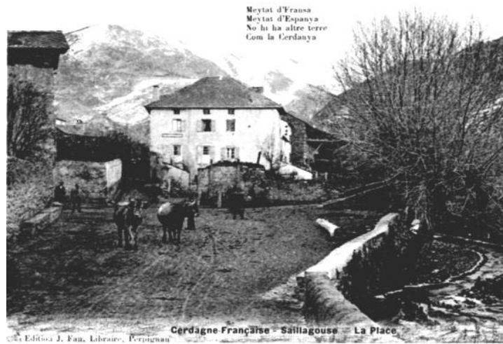
Place del Roser