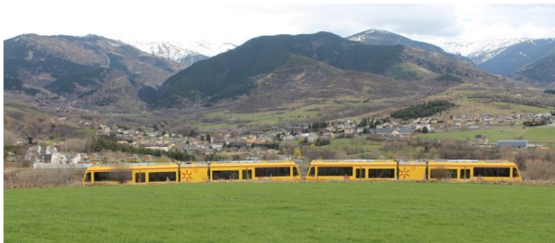
Train Jaune (automotrices Z 150) et en arrière plan Saillagouse