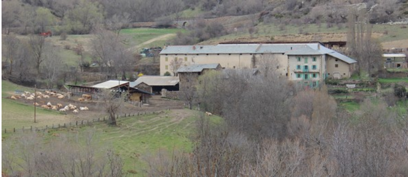
Le Mas Rondole