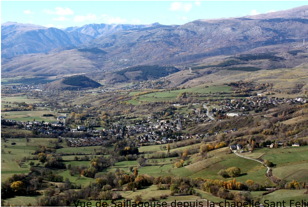
Vue de Saillagouse depuis la chapelle Sant Feliu de Llo