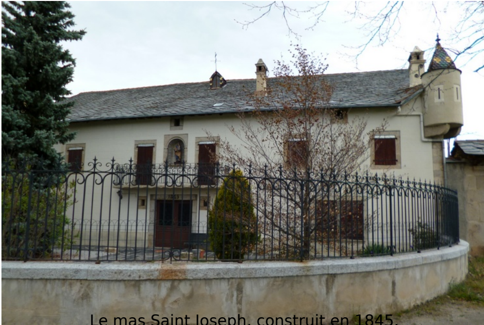
Le mas Saint Joseph, construit en 1845.