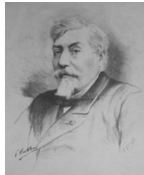
Le sculpteur Oliva, mort à Paris le 22 février Gravure de Dochy d'après dessin de Vuillier Le Monde Illustré N° 1718, 1 er mars 1890.