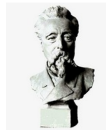
Buste d'Alexandre Joseph Oliva, réalisé par Victorien Antoine Bastet, terre cuite, 1884.