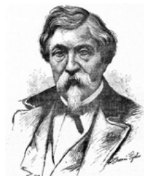
Alexandre Oliva d'après Thomas Pijolin