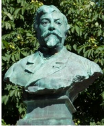
Buste en bronze d'Alexandre Oliva, réalisé par Jean-Baptiste Belloc .