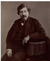
Alexandre Oliva - Atelier Nadar Photographie positif sur papier albuminé d'après négatif sur verre ; 8,5 x 5,8 cm © Bibliothèque nationale de France , département Estampes et photographie, FT 4-NA-235