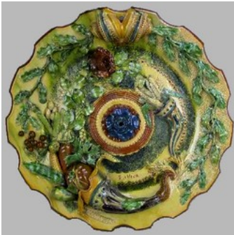
Plat cornes d'abondance - Étienne Oliva