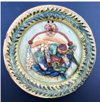
Plat en terre vernissée polychrome - Étienne Oliva - © DR