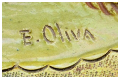
Détail signature de l'artiste (E. OLIVA)