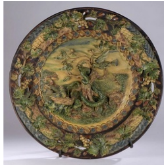
Plat en terre vernissée polychrome