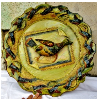
Plat canard terre vernissée - Étienne Oliva