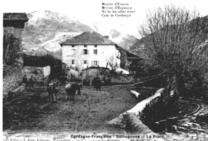
Place del Roser