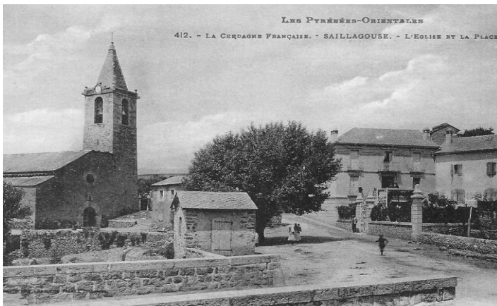
La place de l'église

Construit sur le passage d'une voie romaine, la Via Confluentana / Via Cerdana, SAILLAGOUSE est riche d'un passé de plus de dix siècles d'histoire. C'est une ancienne bourgade de potiers qui possédait des fabriques de tuiles, de briques, de poteries et au début du siècle dernier une fabrique de bonneterie. Actuellement, il ne reste de son passé que quelques maisons anciennes et l'église Sainte Eugénie qui, consacrée en 913, a été restaurée successivement aux XII ème et XVIII ème siècles. De sa conception romane, il ne reste que quelques murs et décorations; par contre, son retable baroque attribué à Sunner est une curiosité à ne pas manquer.