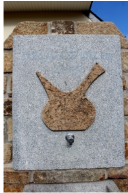
Mairie de Berven-Plouzévé

À l'occasion du jumelage entre Berven-Plouzévé et Saillagouse, et pour marquer cet événement, une fontaine a été inaugurée, installée près de la mairie